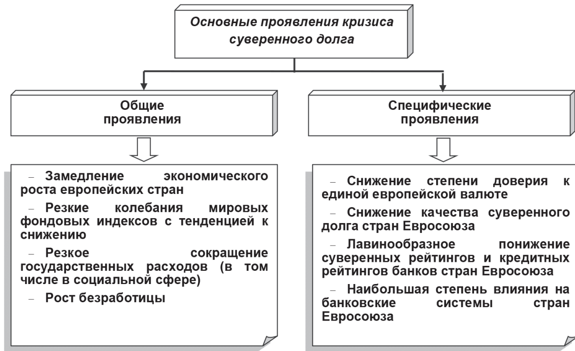
Рис. 3. Классификация проявлений кризиса суверенного долга в странах Евросоюза