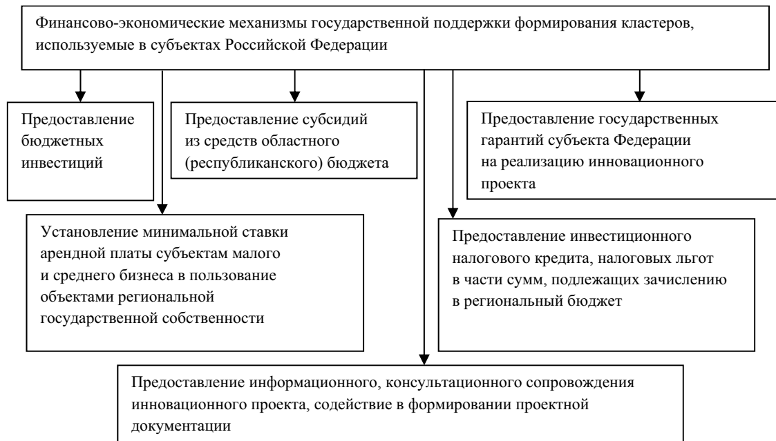
Рис. 4. Финансово-экономические механизмы, используемые в субъектах Российской Федерации при формировании инновационных территориальных кластеров