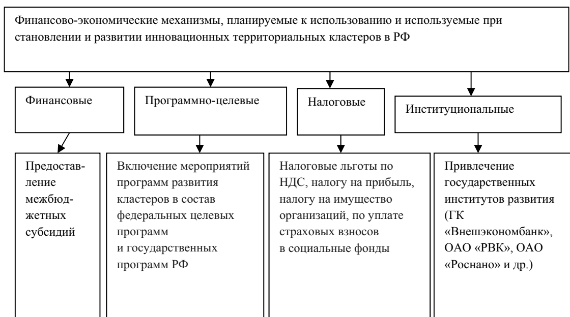
Рис. 3. Финансово-экономические механизмы федерального уровня по развитию инновационных территориальных кластеров в России

Проводя параллель между ФЭМ федерального и регионального уровня, можно заметить, что