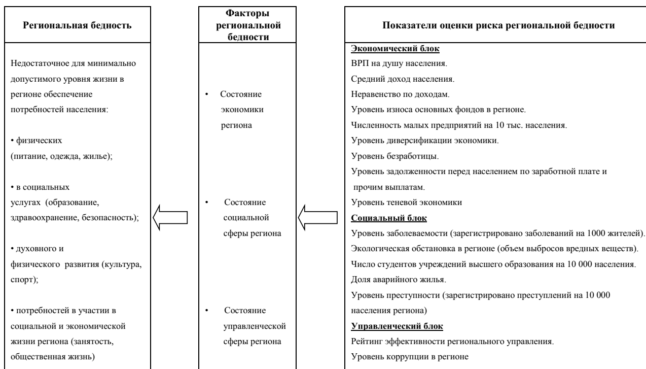
Рис. 2. Комплекс показателей, применяемых для оценки уровня региональной бедности