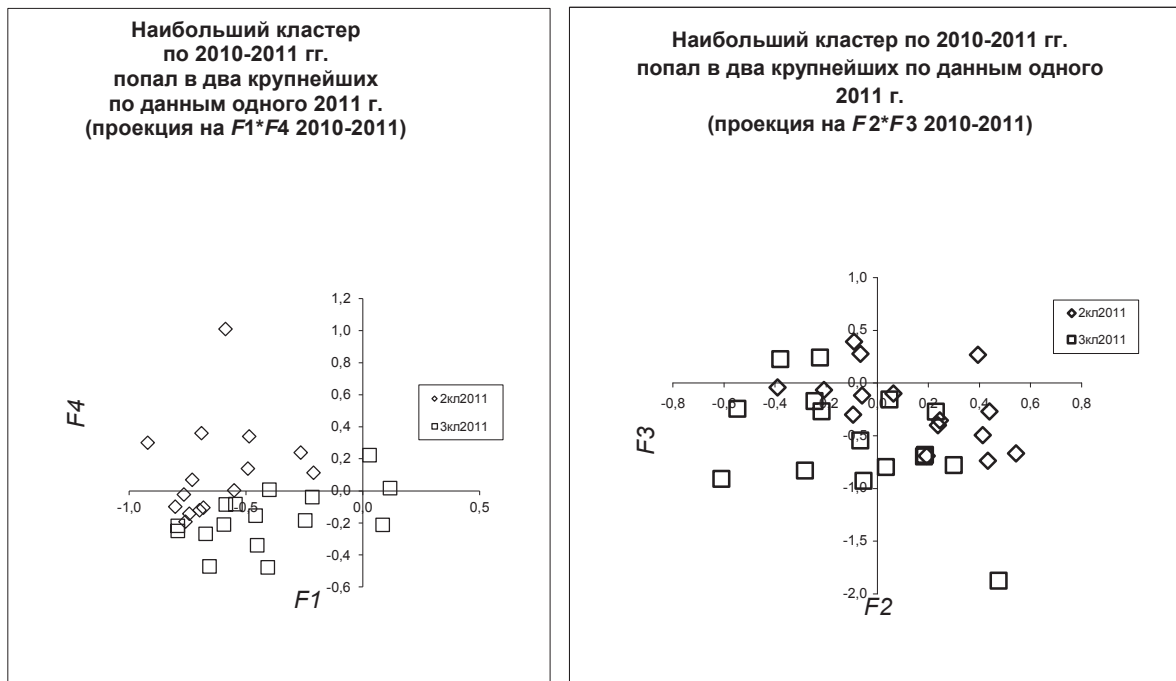
Рис. 2. Распределение наибольшего кластера 2010–2011 гг. по наибольшим кластерам 2011 г.

несомненно, интересной и заслуживающей внимания задачей.