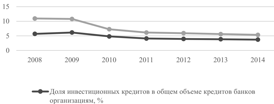
Рис. 2. Доля инвестиционных кредитов в общем объеме банковских кредитов, предоставленных организациям на срок более 1 года

Формирование финансового сектора, ориентированного на достижение устойчивого экономического роста, требует торможения различных форм дестабилизации финансовой