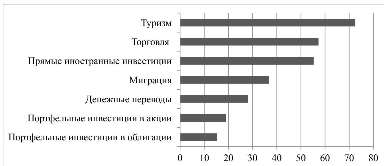
Рис. 2 / Fig. 2. Показатели региональной интеграции в Азии, в% от общего объема (данные по 48 странам – членам Азиатского банка развития), 2016 г. / Indicators of regional integration in Asia, in% of total volume (statistics on 48 member countries of the Asian Development Bank), 2016